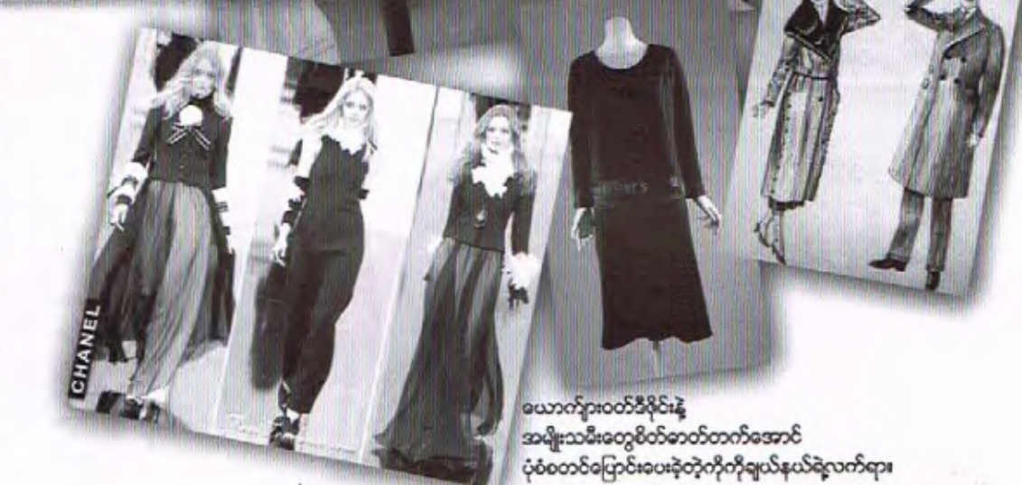
ယောက်ျားဝတ်ဒီဇိုင်းနာအမျိုးသမီးတွေစိတ်ဓာတ်တက်အောင် ပုံစံတင်ပြောင်းပေးခဲ့တဲ့ကိုကိုချန်နယ်လဲလက်ရာ။

ကျဆုံးခဲ့ကြတဲ့အပေါ် ဝမ်းနည်းခြင်းအဖြစ် အနက်ရောင်ဝတ်စုံတွေကို ငယ်ရွယ်တဲ့မိန်းကလေးတွေ အများဆုံးဝတ်ဆင်လာကြတာကို သူ့သတိထားမိခဲ့တယ်။ အနက်ရောင်တွေ များများဝတ်ဆင်နေကြတာကို သူ့မြင်ပုံက မိန်းကလေးတွေ ပုံမှန်ဝတ်ဆင်နေကြတဲ့ ဝတ်ဆင်မှုတွေထက် ‘အနက်ရောင်’ ပါတဲ့ဝတ်စားဆင်ယင်မှုက ပိုပြီး chic ဖြစ်တယ် (စတိုင်ကျယ်)ဆိုတာ မြင်လာတယ်။