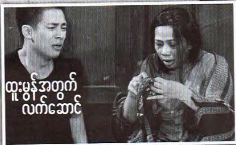
ထူးမွန်အတွက် လက်ဆောင်

၂၀၁၇ အကယ်ဒမီမှာ အကောင်းဆုံးအမျိုး သမီးဇာတ်ပို့ဆုနဲ့ တည်တည်ကြီးကြီးလွဲခဲ့ရတဲ့ လိုင် လာခန်းက ယခုနှစ်အကယ်ဒမီကို မတက်တော့ ဘူးလို့ပြောပါတယ်။ လတ်တလောမှာ သင်တန်း တစ်ခုလည်းဖွင့်ထားတယ်လို့သိရတာမို့ အကယ် ဒမီခံစားမှုအပါအဝင် လိုင်လာခန်းနဲ့ အင်တာ ဗျူးဖြစ်ခဲ့ပါတယ်။