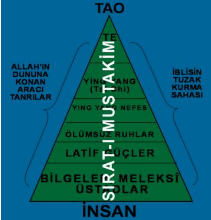
TAOİSTLERDE ARACI TANRILAR

Aşağıdaki tablo, bu benzerliği sergilemektedir.