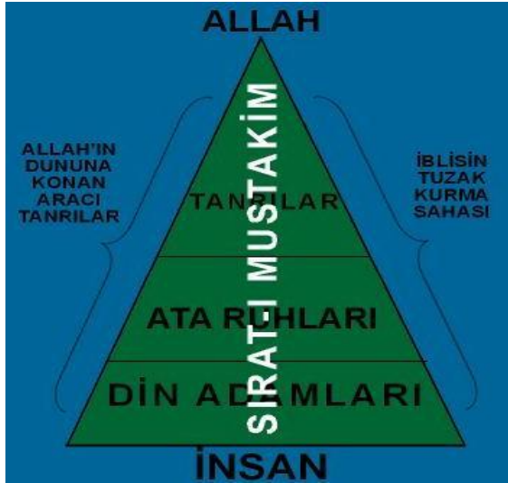
ŞİRKİN GENEL YAPISI

Şirkin yapısı aşağıdaki gibi gösterilebilir: