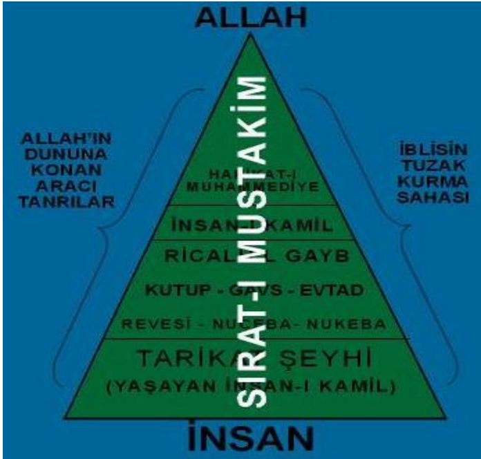
TARİKATLARDA GÖRDÜĞÜMÜZ ARACILAR

Hristiyanlıkta aracılık inancı olduğu genişçe anlatılmıştı. Ona benzer bir inancın bir kısım tarikatlarda da olduğunu göstermeye çalışacağız. Aslında incelediğimiz tarikatların tamamında aracılık inancının var olduğunu gördük. Tarikatların hepsini incelemediğimiz için ihtiyatlı bir dil kullanmayı uygun bulduk. Tarikatlardaki aracılar, Hristiyanlarda ve Taoistlerde olana benzer bir yapı oluşturmaktadır. Bu yapı, yaklaşık olarak şöyledir: